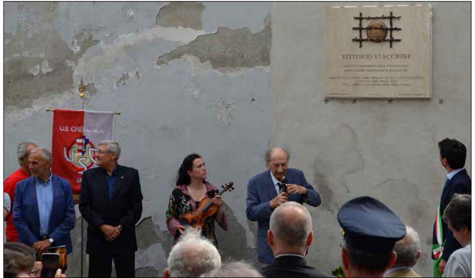
Stadio Zini posa della lapide a Staccione