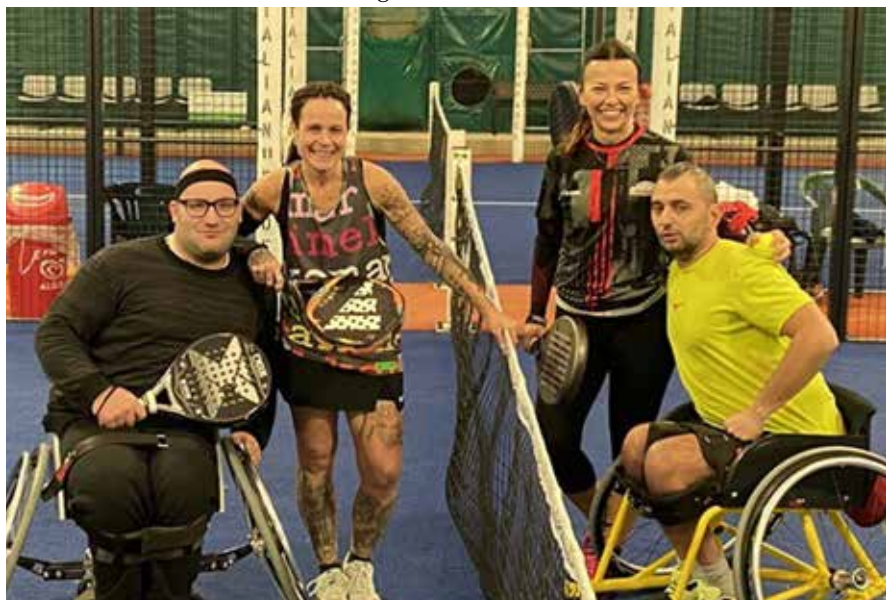
Due coppie partecipanti

Il torneo inclusivo del Cremona Arena è stata una bella esperienza per tutti, sicuramente da ripetere.