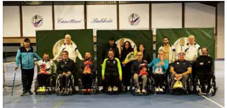
Foto di Gruppo dei partecipanti al Torneo